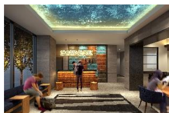
ホテル WBF フォーステイ札幌