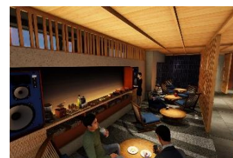
ホテル WBF 函館海神の湯