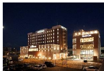
ホテル WBF グランデ旭川