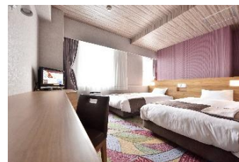
ホテル WBF 釧路